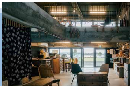
利用する人々が会えるようにこだわった受付スペース