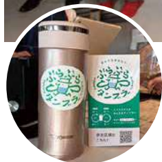
ぶらぶらタンブラーがレジ前に置かれてました！