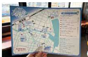
焼津ぶらぶらマップ。タンブラー提供・回収場所が載っている。