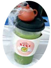
抹茶フェスで初登場! 急須からもうまく 湯気が出る?! ヤマチョウ 鈴木長十商店 さん