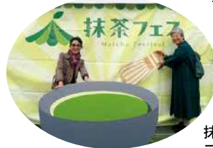
抹茶フェスの フォトスポット