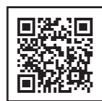
活用術セミナーのお申込みはこちらから